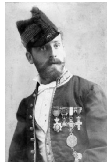
Toda amb l'uniforme de vicecònsol (1883?).