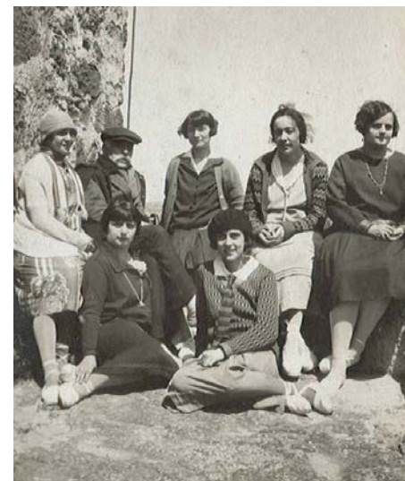
Grup d’alumnes amb Eduard Toda, d’excursió a Escornalbou. 1926

Amb motiu del setanta-cinquè aniversari de la mort d’Eduard Toda, l’autora analitza la seva activitat com a bibliòfil i mecenes de biblioteques, amb la qual va contribuir a enriquir les biblioteques i els arxius del país, i la relació que va tenir amb l’Escola de Bibliotecàries, on va ser professor des de la segona meitat dels anys vint fins a 1938. Durant una bona colla d’anys, les alumnes de l’Escola van fer estades al castell d’Escornalbou, primer, i després al monestir de Poblet, on Toda s’instal·la a inici dels anys trenta per dirigir-ne la restauració.